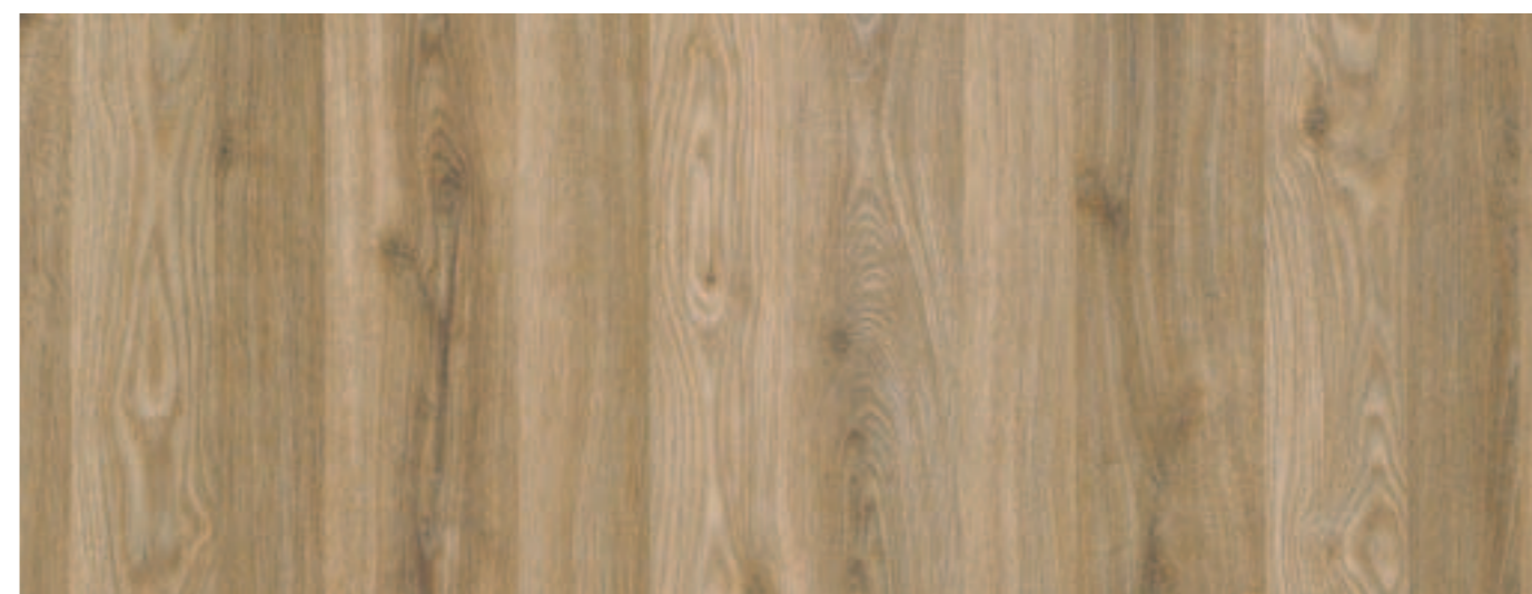
NOCE / WALNUT