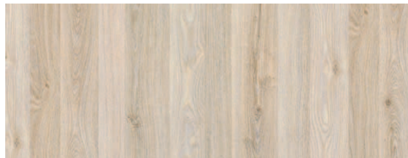
LEGNO GRIGIO / GREY WOOD