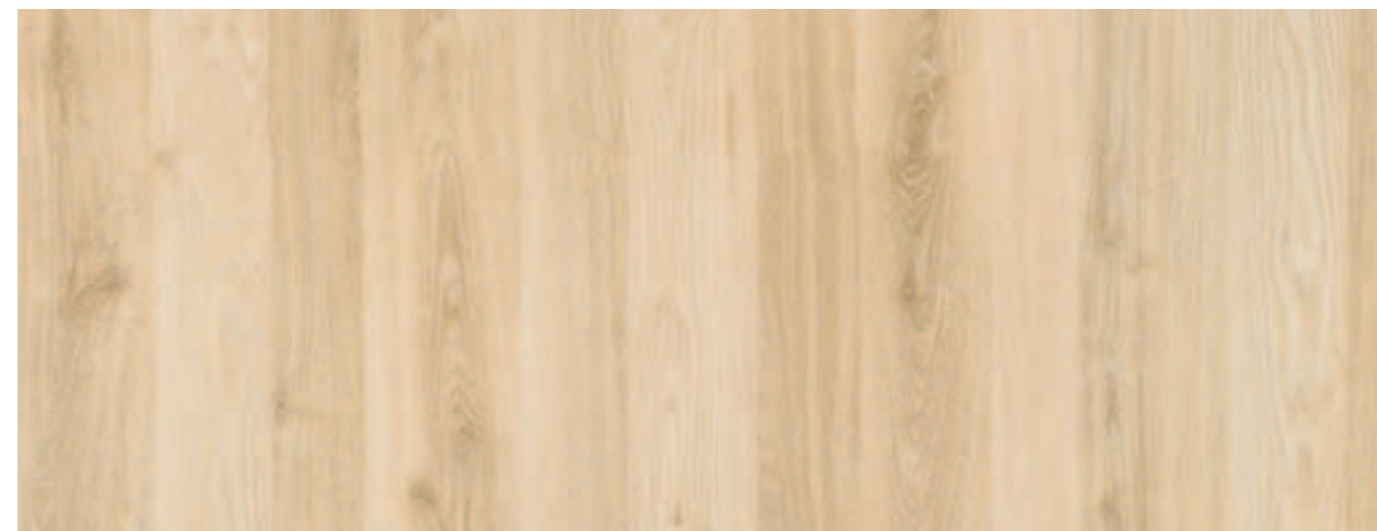
NATURALE / NATURAL